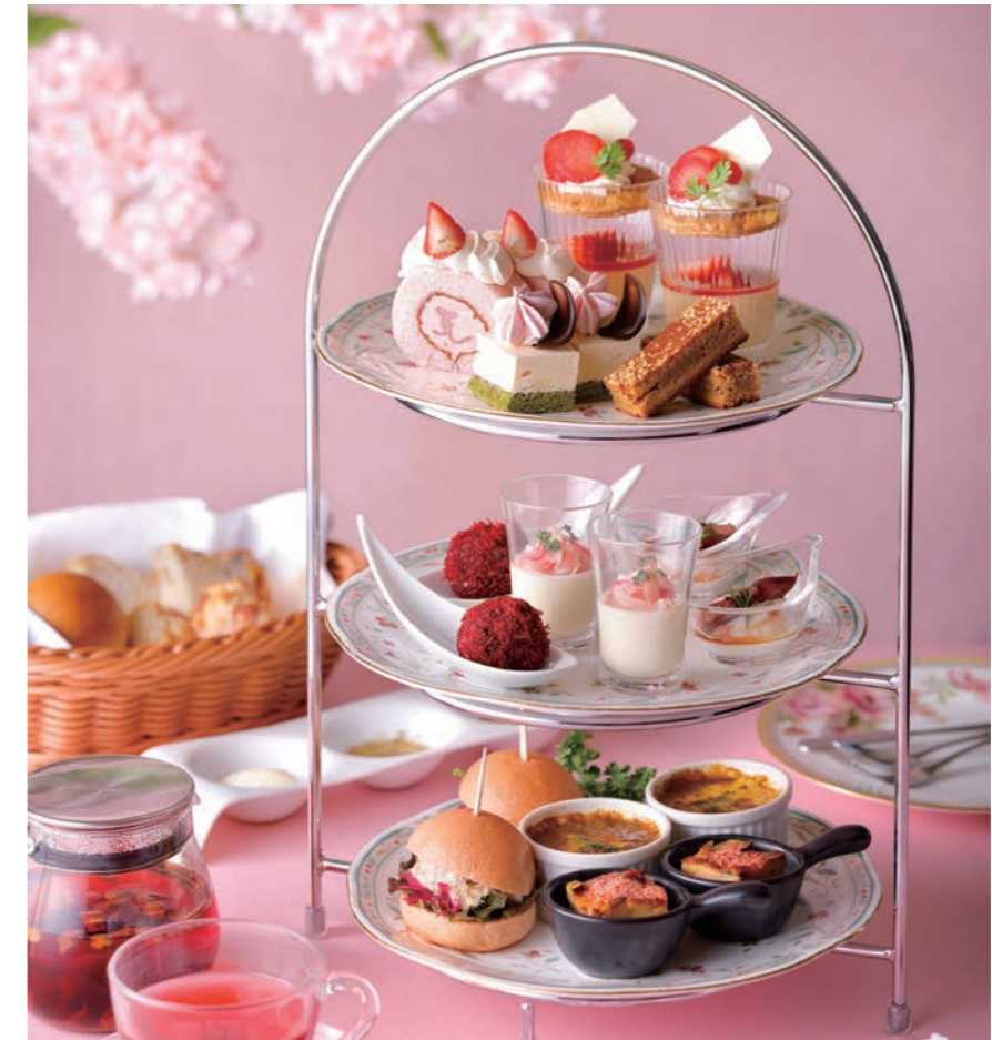
2名様盛りイメージ