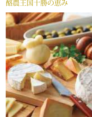
酪農王国十勝の恵み ワインとの相性も抜群の十勝産チーズです。