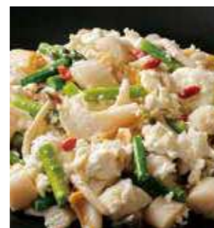
帆立とツブの卵白炒め