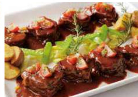
牛肉の煮込み プロバンス風