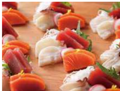
お造り三種盛り合わせ