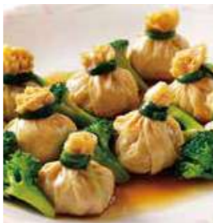
鶏と腸詰の湯葉巻き蒸し