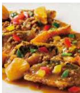
鯖のシンガポール風煮込み