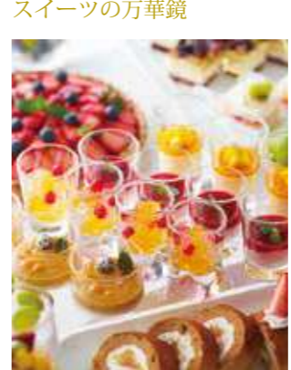
スイーツの万華鏡 女性のお客様にお喜びいただける華やかなデザートbuffetです。