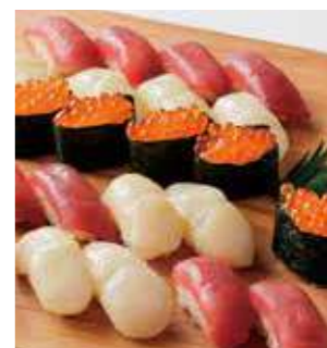
生寿司盛り合わせ