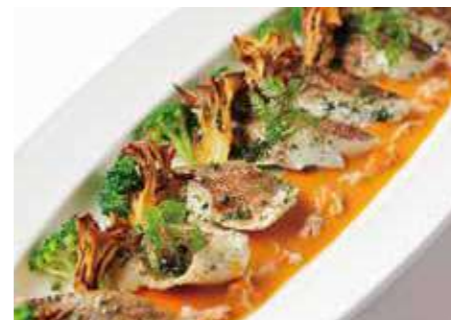
メバルの香草蒸し 蟹入りナンチュア風ソース