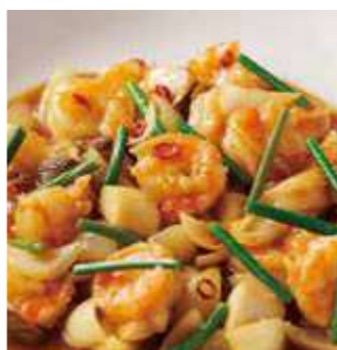
大海老の酸味を効かせた 唐辛子炒め