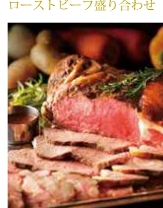
ローストビーフ盛り合わせ 少し贅沢なパーティーシーンに人気の一品です。