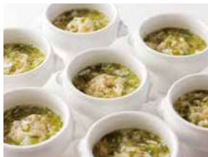
豚肉焼売の茶碗蒸し仕立て あおさ海苔あんかけ