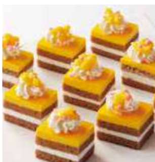
マンゴーとライチの ムースケーキ