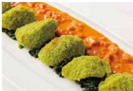
カラスカレイのヴィエノワーズ ベーコンと玉葱のトマトクリームソース