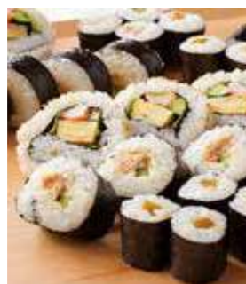
海苔巻き盛り合わせ