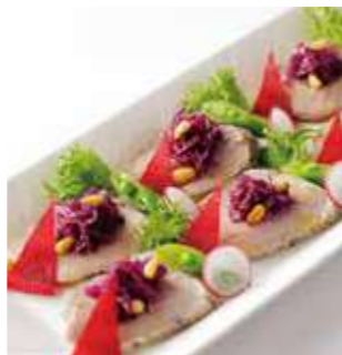
豚フィレ肉のサラダ仕立て 紫キャベツのマリネ添え