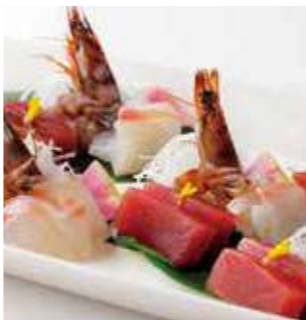
お造り三種盛り合わせ