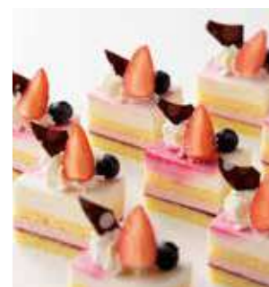
レアチーズと苺の ムースケーキ