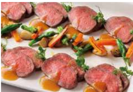
牛肉の低温蒸し焼き 山わさびソース