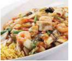
あんかけ焼きそば