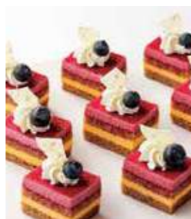
カシスとオレンジの ムースケーキ