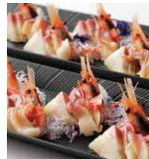
お造り三種盛り合わせ