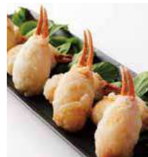
蟹爪と海老の クリーム網脂巻き