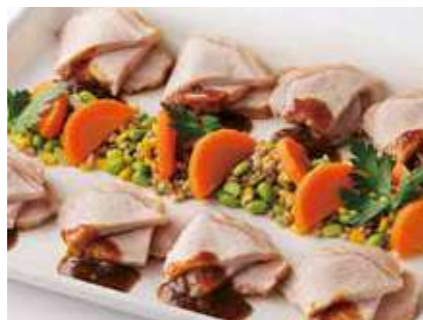
ローストポーク オニオンソース