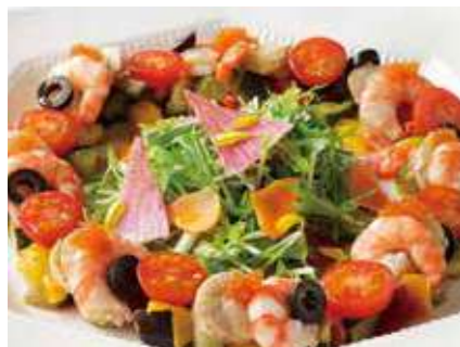
シーフードと野菜のマリネ