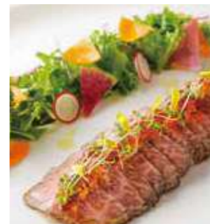
牛肉のタリアータ 和風香味ジュレ