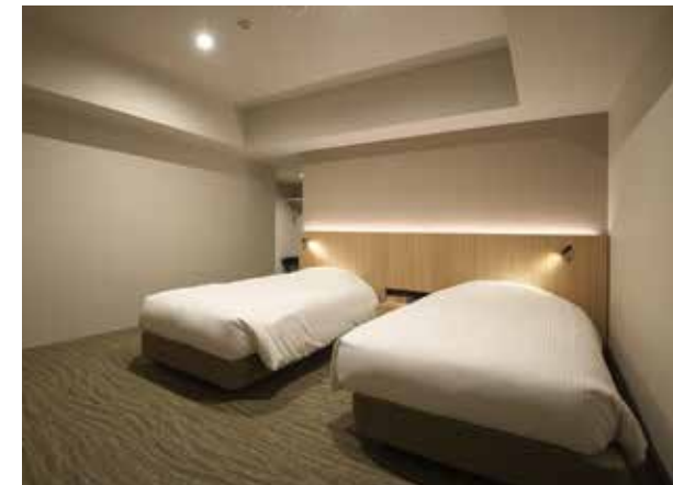
ユニバーサルルーム

全90室/20㎡ 人数:1~2名 ベッドサイズ:1,100mm×1,950mm TVサイズ:43インチ ※シャワーブースのみ